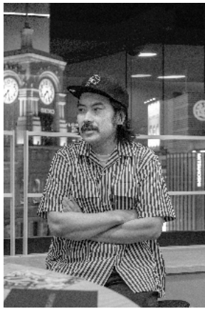
金氏 徹平 | Tepei Kaneuji

https://bijutsutecho.com/magazine/news/report/25927 [公開日 2022年8月20日]