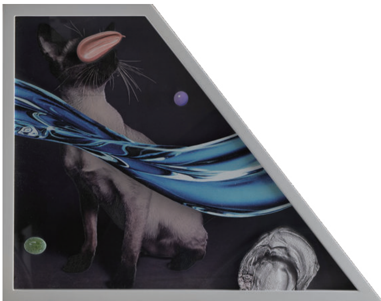
金氏 徹平 / Teppei Kaneuji 海と猫(猫の写真)#13 / Sea and Pus (Photograph of Cat) #13 524 x 413 mm (image) / 560 x 449 mm (framed) UV inkjet print (StareReap 2.5 print) on acrylic board, polycarbonate

私たちは半ば無自覚に、体系的に物事を洗練しようしたり、自らの感情に向き合い続けています。通り過ぎてしまいそうなありふれた光景であっても、一度立ち止まることで、その中に何かしらの気付きがあるのかもしれない。本展がそのような発見のきっかけになれば嬉しく思います。